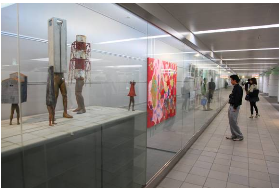
2010年 会場風景(行幸地下ギャラリー)

次代を担う新鋭アーティストたちのフレッシュなエネルギーが溢れる丸の内へ、ぜひお越しください。